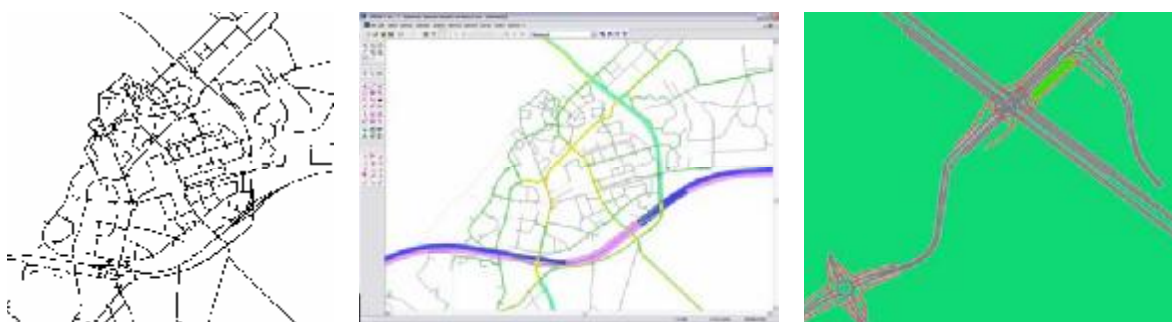
Figuur 2: Van links naar rechts: Harderwijk in Questor, Visum en Vissim

Figuur 2 geeft een beeld van het oorspronkelijke Questor model, het naar Visum geconverteerde model en een detail uit het Vissim model.